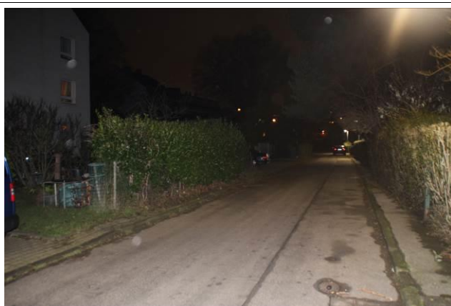
Auf dem Plue

3. Wie in der Verwaltungsvorlage angemerkt, wäre in den Straßen Auf dem Plue, Rosenweg, Nelkenweg und Staudenweg ein aufgeschultertes Längsparken möglich (außer in den Kurven und an Einfahrten). Die Gehwege sind ohnehin zu schmal, um darauf zu laufen. Im Gegenzug könnte die gesamte Zone als verkehrsberuhigter Bereich ausgeschildert werden, damit Fußgänger die Fahrbahn nutzen dürfen. Bei einer zukünftigen Sanierung könnten die Straßen niveaugleich ausgebaut werden. Am Tulpenweg wäre bei niveaugleichem Ausbau beidseitiges Parken möglich.